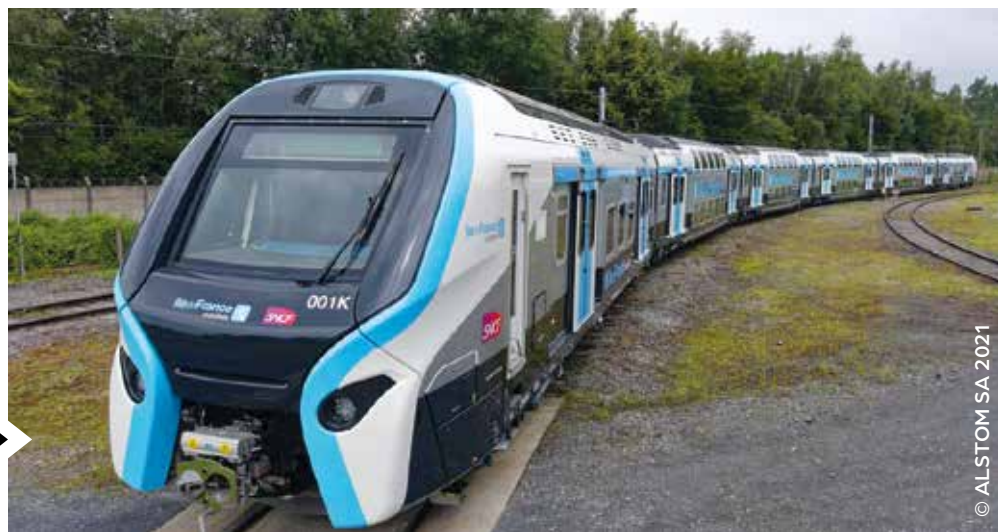
RER D : fin 2024, les nouvelles rames RER NG (Nouvelle Génération) se déploieront sur la ligne.

S'agissant du plan de circulation et de la régularité du RER D, la SNCF n'est toujours pas au rendez-vous de ses obligations contractuelles avec Île-de-France Mobilités (IDFM). Le programme SA 2019 de la SNCF a permis de « métroïser » le fonctionnement de la branche Plateau (gares d'Évry-Courcouronnes et du Bras de Fer) avec, par exemple, deux trains tous les quarts d'heure aux heures de pointe. Mais la correspondance obligatoire pour les autres branches de la ligne s'est avérée un échec durement subi par les usagers concernés.