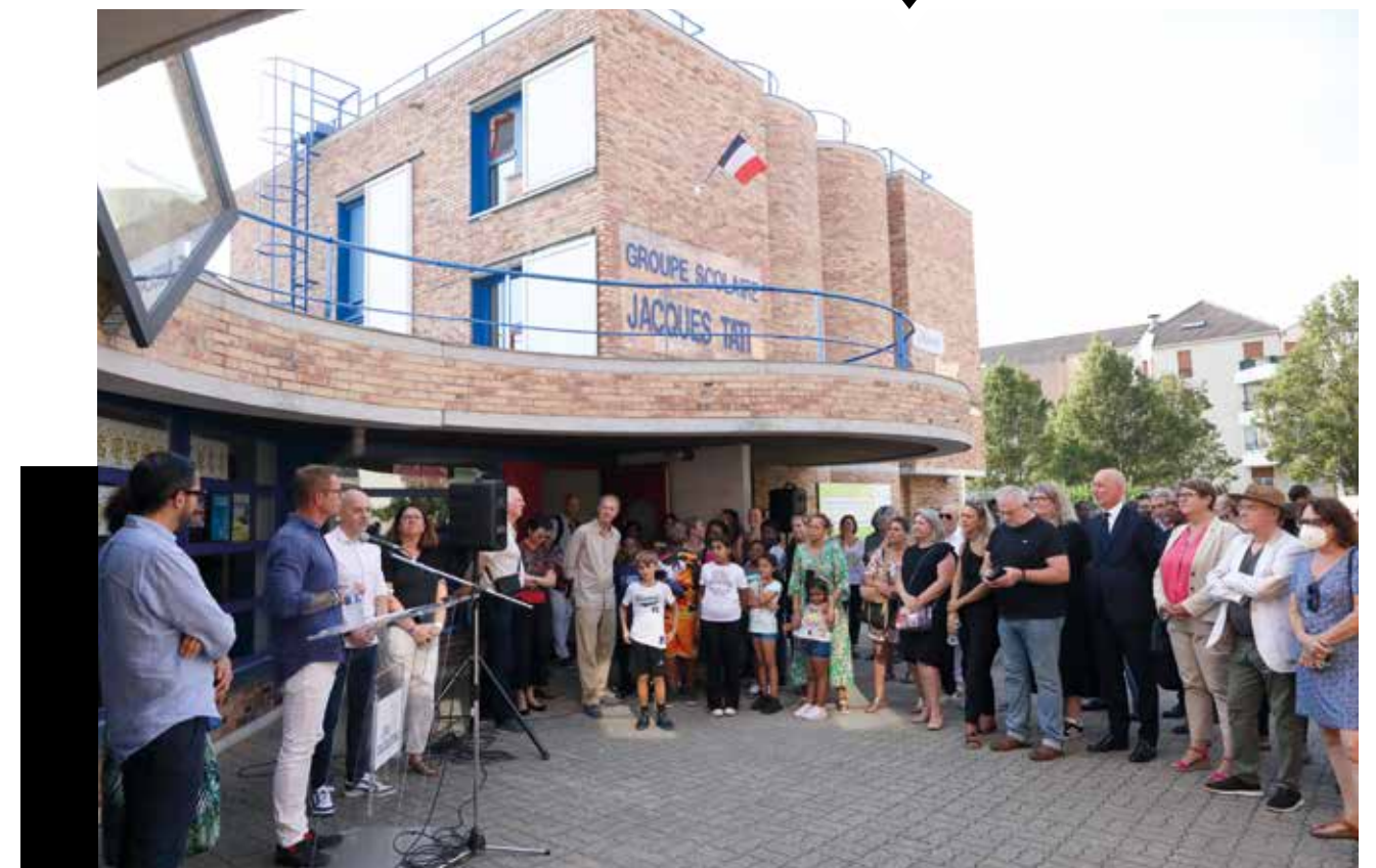
Le 8 septembre 2023, le groupe scolaire Jacques Tati a été inauguré après une réhabilitation de 8 millions €. Entre 2020 et 2026, 14 écoles et structures liées à l'enfance seront complètement reconfigurées et modernisées pour un montant de 150 millions €, soit 50% du Plan Pluriannuel d'Investissement (PPI) 2020-2026.