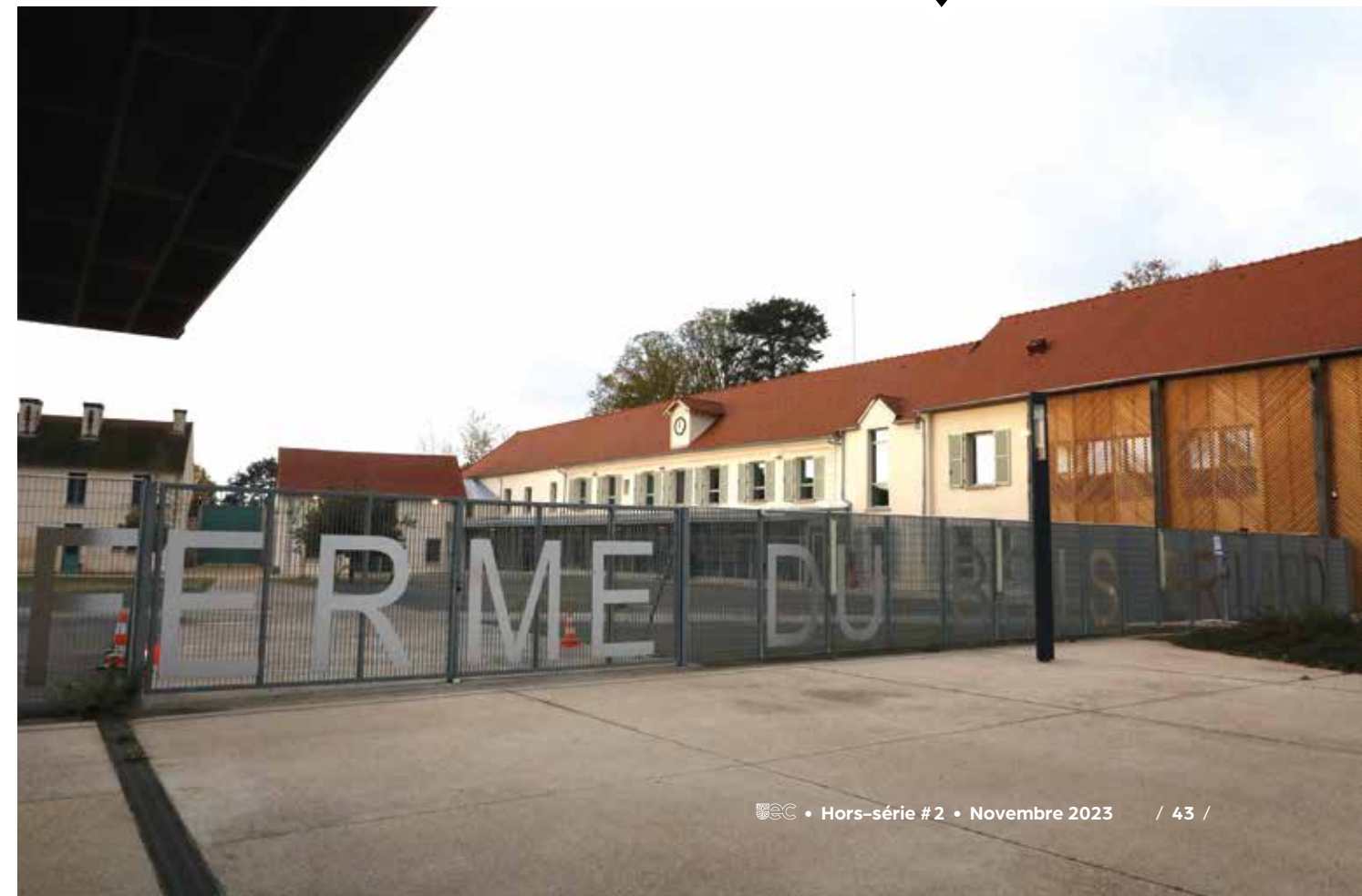
Depuis l'automne 2023 Évry-Courcouronnes, accueille l'école internationale de musique Didier Lockwood à la Ferme du Bois Briard. Cette bâtisse patrimoniale exemplaire a bénéficié d'une rénovation entièrement financée par l'Agglomération Grand Paris Sud.