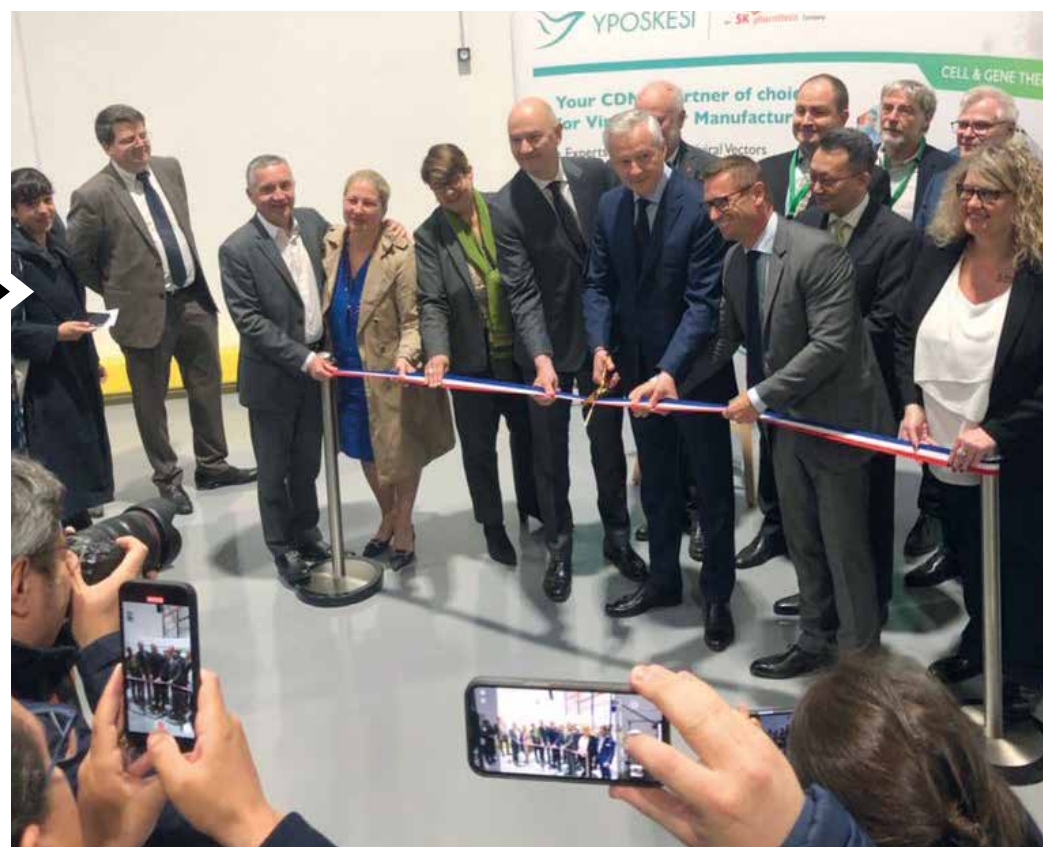
Le 12 mai 2023, le ministre de l'Économie, des finances et de la souveraineté industrielle, Bruno Le Maire, et le ministre délégué à l'industrie, Roland Lescure, inaugurent la seconde unité de production de la société Yposkesi sur le campus Genopole.