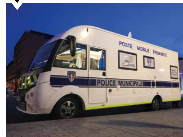
Nouveau poste mobile de la Police municipale.

Le 3 juin 2023, la Ville a organisé pour la première fois une journée inédite dédiée aux métiers de la sécurité et du secours : Pol' Prox Académie . Aux manettes, la Police Municipale et l'association Brigade Académie ont concocté un programme d'activités riche et spectaculaire. Au menu, des baptêmes en hélicoptère, des tours au bord de l'Argus, le bateau de la police municipale, un circuit d'éducation routière, un bubble foot , mais aussi un parcours d'habileté motrice. Plus de 5 000 visiteurs ont répondu présents. Les recettes de la journée – buvettes, ventes de produits etc. – ont été reversées au profit du service pédiatrique du Centre Hospitalier Sud Francilien (CHSF). Forte du succès de cette première édition, la Ville entend reconduire l'événement, d'année en année, à la fin du printemps ●