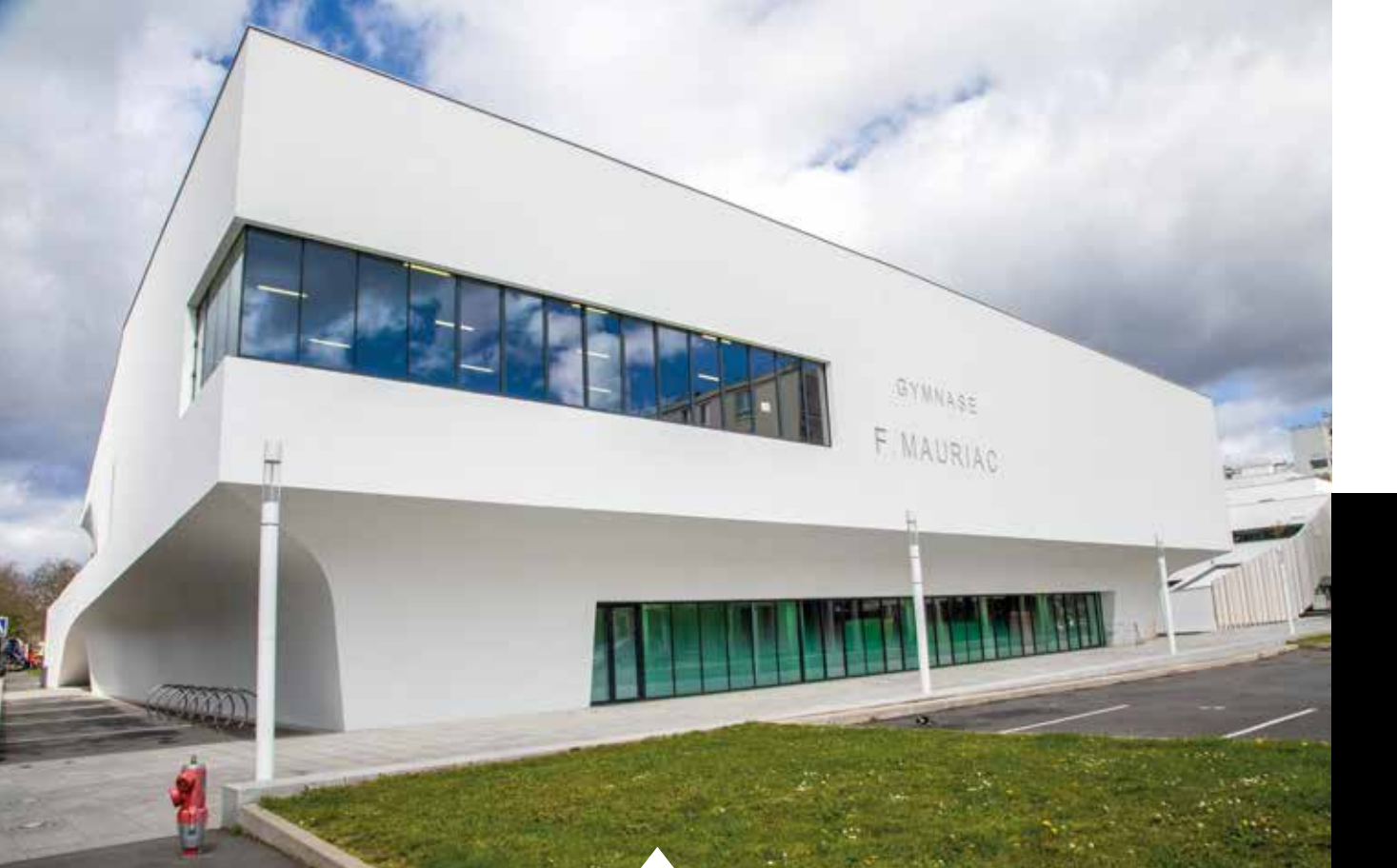
L'ouverture, début 2022, du flamboyant gymnase François Mauriac, témoigne de la politique volontariste de la Ville en faveur du sport.