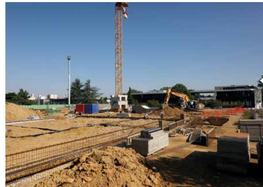
Débutée en avril 2023, la construction du futur Pôle enfance des Loges accueillera jusqu'à 200 enfants. Ce projet fait partie de l'ambitieux Programme de Renouvellement Urbain du quartier Pyramides - Bois Sauvage-Bois Guillaume. Réception du chantier attendue pour septembre 2024.