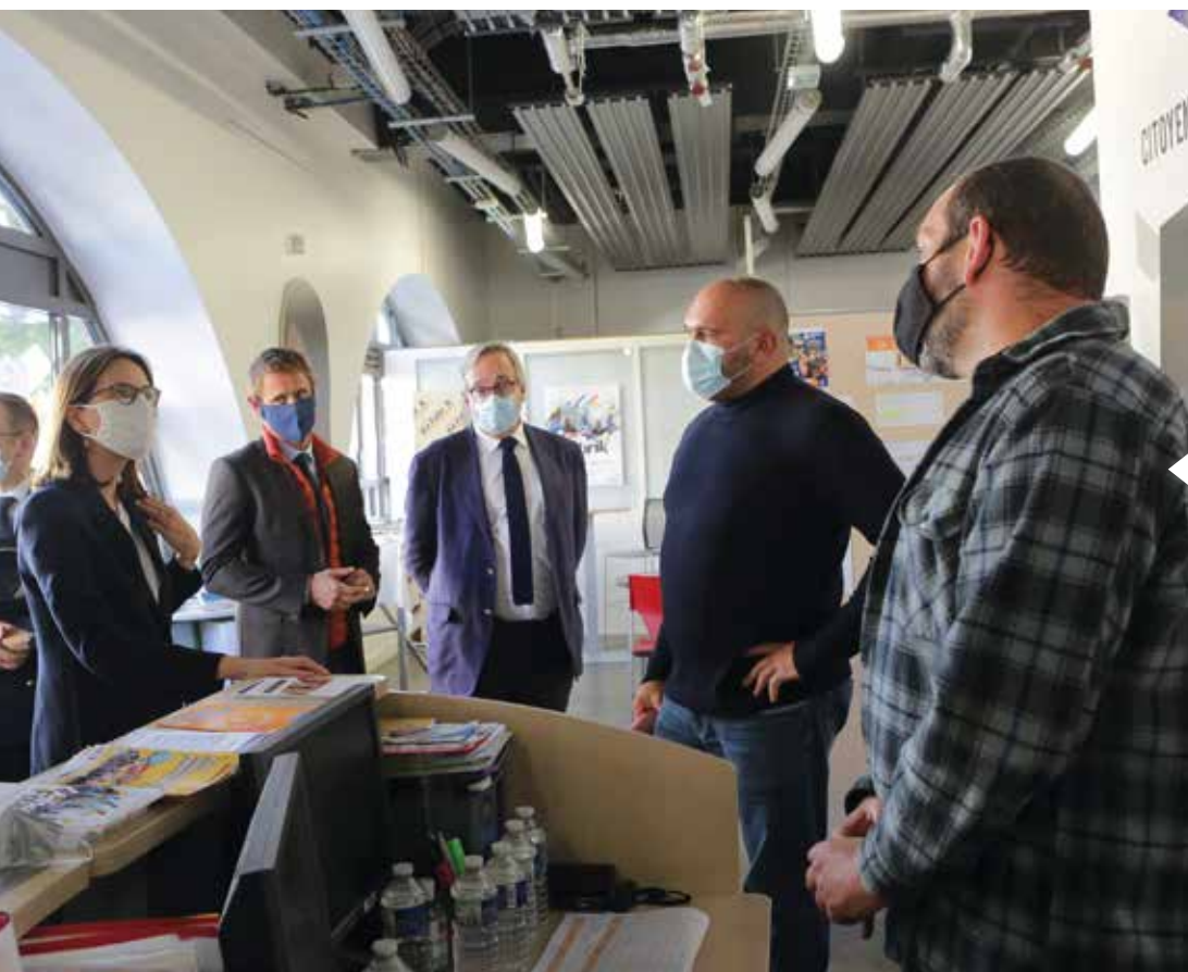
Amélie de Montchalin, ministre de la Transformation et de la fonction publique en visite à La Fabrik', le 9 octobre 2020.