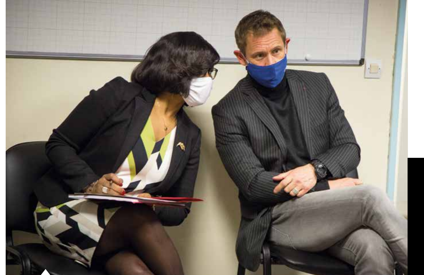
Déplacement, le 15 janvier 2021, d'Elisabeth Moreno, ministre déléguée à l'Égalité entre les femmes et les hommes, à la diversité et à l'égalité des chances.