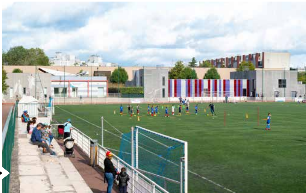
Le stade Jean-Louis Moulin a connu de nombreux travaux d'embellissement.