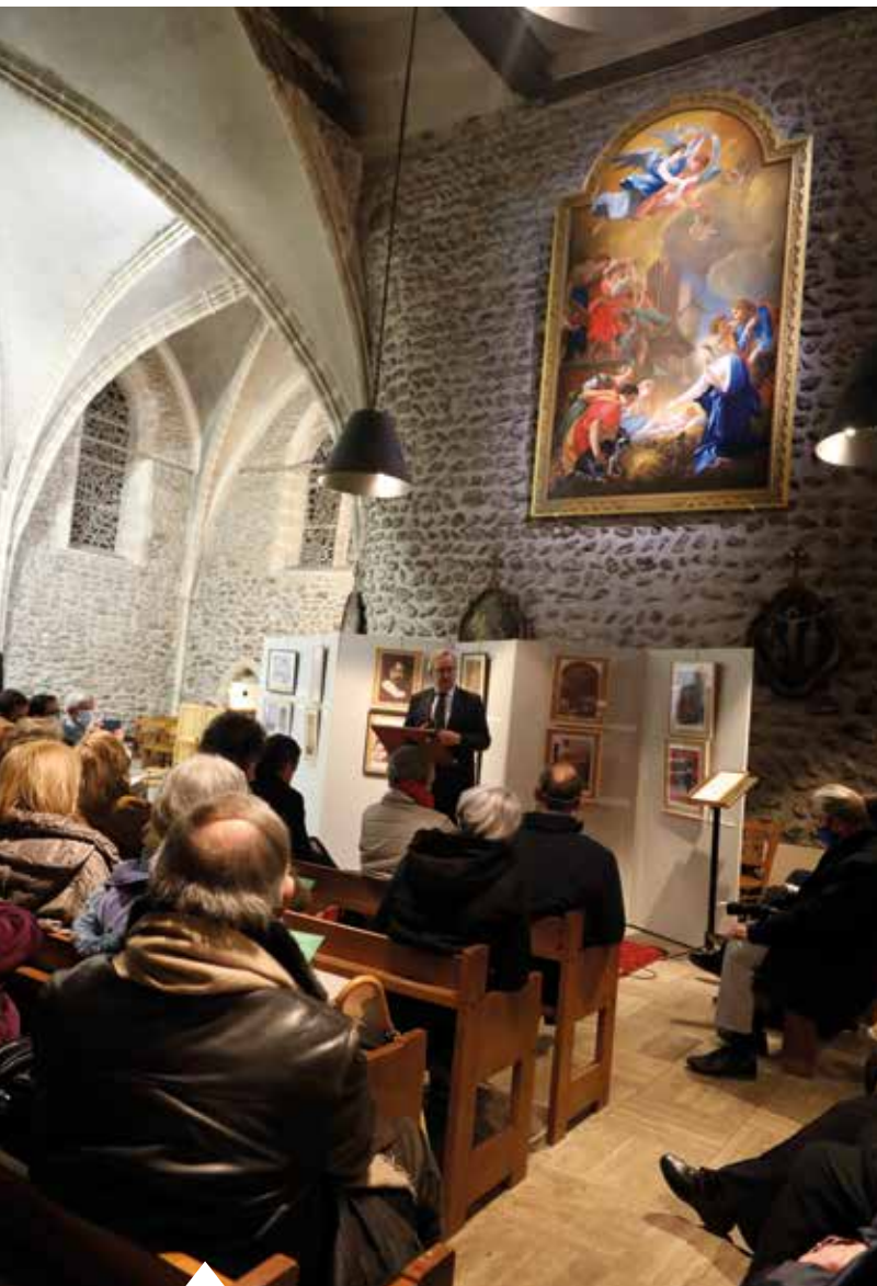
Le 3 février 2022, les Évry-Courcouronnais étaient invités à célébrer, dans la petite église Saint-Pierre-Saint-Paul, le retour de la toile de Simon Vouet après plusieurs mois de restauration.