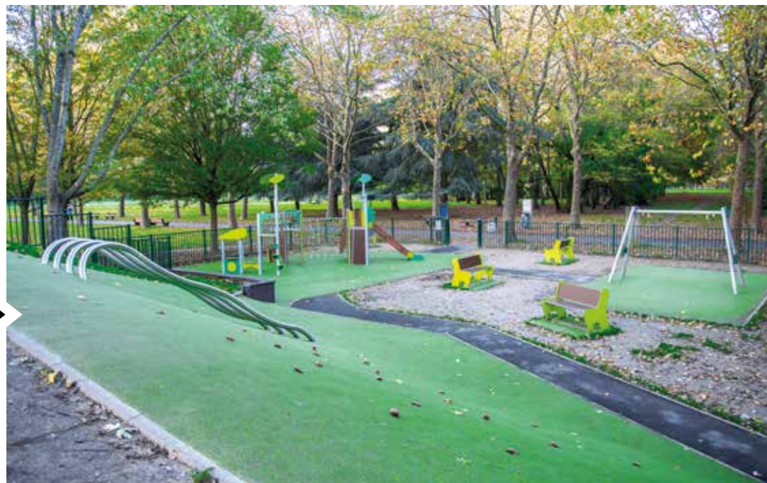
Réceptionnée au printemps 2022, la nouvelle aire de jeux du parc des Coquibus se distingue par une grande fonctionnalité et sécurité. Inclusifs, ses équipements sont adaptés aux enfants porteurs de handicap.