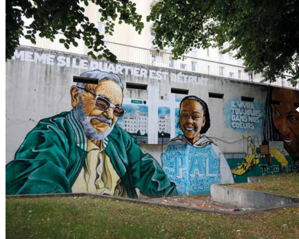
Le 17 septembre 2022, le quartier du Parc aux Lièvres (Pal) était à l'honneur dans le cadre de la nouvelle édition du Festi'Pal. Une édition au cours de laquelle de nombreuses animations et œuvres de Street Art ont permis de valoriser la mémoire de ce quartier appelé à connaître une profonde transformation.

L'équipe municipale a également fait le choix d'associer systématiquement une démarche de mémoire aux grands projets de renouvellement urbain. Les transformations profondes de certains quartiers sont l'occasion de recueillir des témoignages, des objets, des photos, des articles de presse, des souvenirs, des écrits, des voix... une façon de garder une trace de ce passé, de se le réapproprier, de raconter une histoire commune. Des artistes accompagnent ces dynamiques locales. Fin 2021, des œuvres grand format du peintre Hugues Anhès ont été exposées sur les murs des immeubles du quartier du Parc aux Lièvre-Bras de Fer. Ce projet a été porté par le