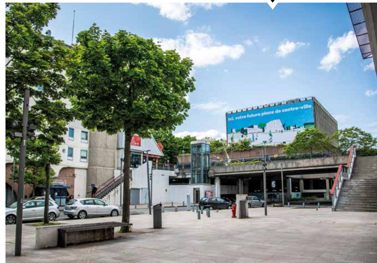
Après son acquisition par la Ville, la démolition, en 2024, de l'ex-poste du centre-ville, sera emblématique de la reconfiguration complète que l'Exécutif municipal entend donner à Évry-Courcouronnes. La bâche de l'artiste Franck Senaud déployée sur le bâtiment, le 24 mai 2023, a pour ambition de projeter les habitants et les passants dans leur future place de centre-ville.

Nouveaux quartiers, écoles, lieux dédiés à la petite enfance, voirie, transports, transition écologique... Depuis 2020, Évry-Courcouronnes s'est lancée, avec le soutien de ses partenaires, dans un programme de grands travaux et de rénovation tous azimuts. Autant de chantiers qui doivent projeter la Ville à l'horizon 2030.