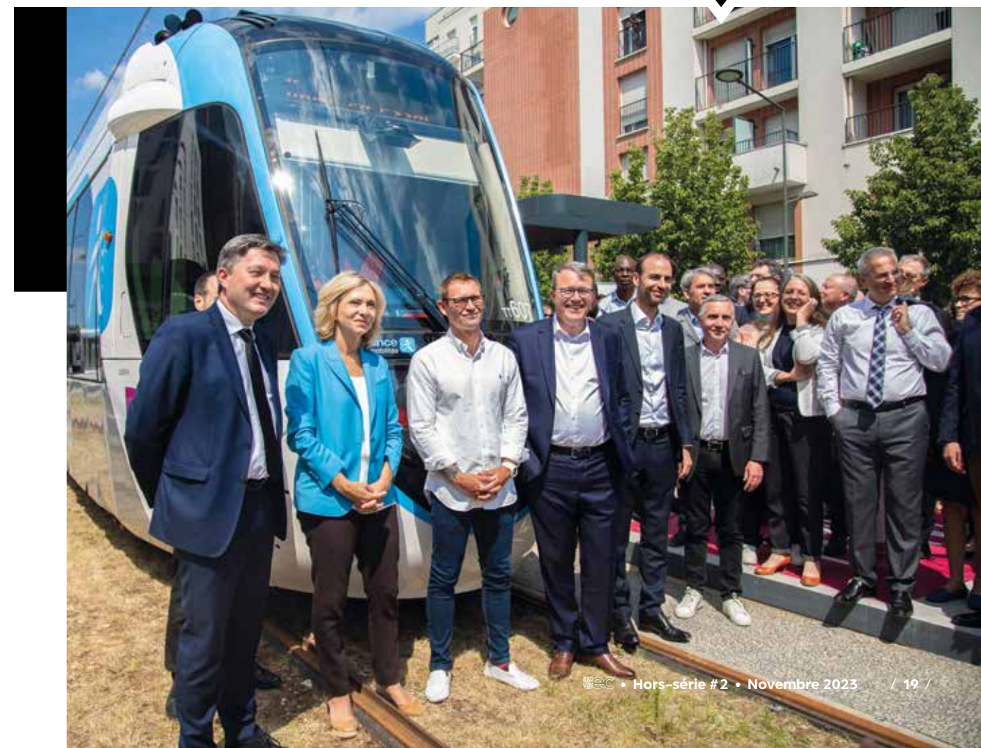
La présidente de la Région Île-de-France, Valérie Pécresse, en déplacement à Évry-Courcouronnes à l'occasion des premiers essais à vide des rames du futur Tram T12, le 6 juillet 2023.