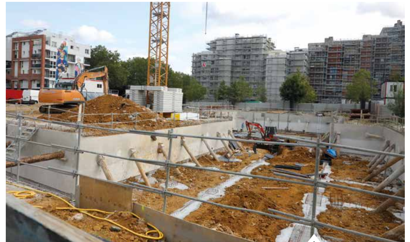
La future Maison des Services Publics du quartier des Pyramides sort de terre. (Photo : septembre 2023)