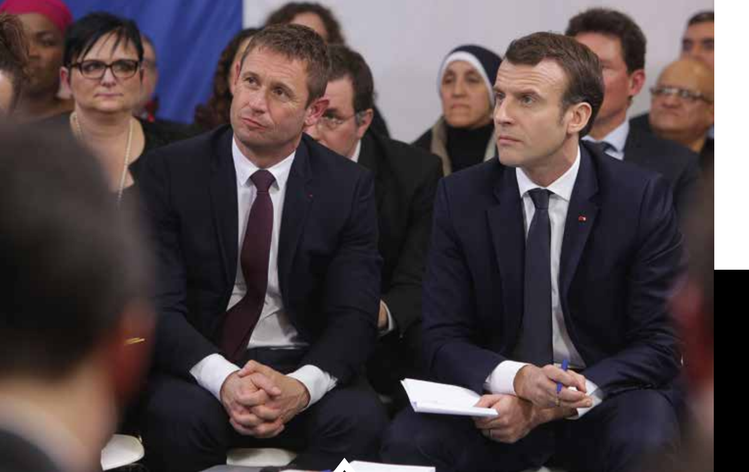
Le 4 février 2019, Évry-Courcouronnes a été la première étape francilienne de la série de consultations qu'Emmanuel Macron a initiées avec les Français à la suite de la crise des Gilets Jaunes.