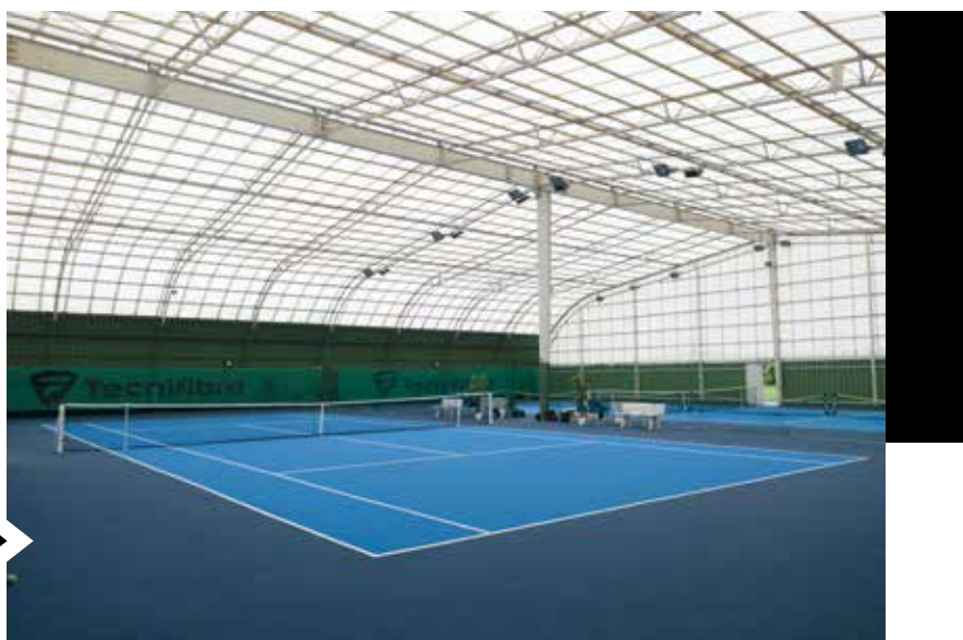
En novembre 2021 ont été inaugurés les terrains rénovés de tennis de l'Amicale Sportive d'Évry, près des bords de Seine.