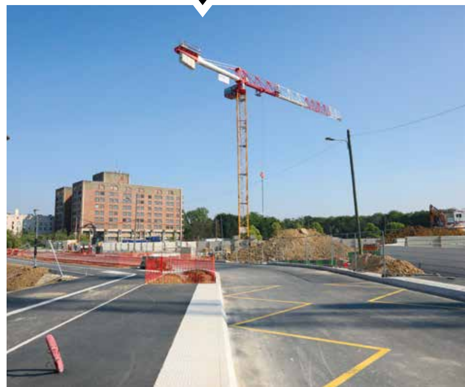
L'aménagement de l'écoquartier Les Horizons a nécessité d'importants travaux sur l'espace public à partir de fin 2022. Ici, la restructuration de la rue du Pont Amar qui privilégie désormais les mobilités douces comme les trottinettes, les vélos ou la marche.