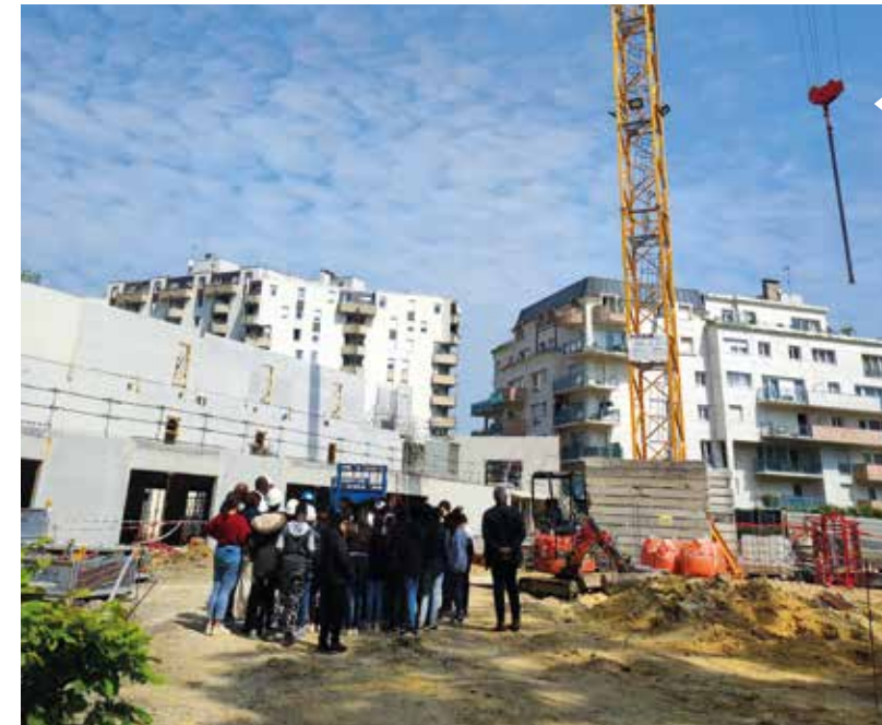
L'évolution démographique oblige l'adaptation de nombreux groupes scolaires comme celui des Coquibus dont l'extension doit permettre de construire de nouvelles classes. Ici, la visite, le 22 mai 2023, de ce chantier dont les travaux s'élèvent à plus de 15 millions €.