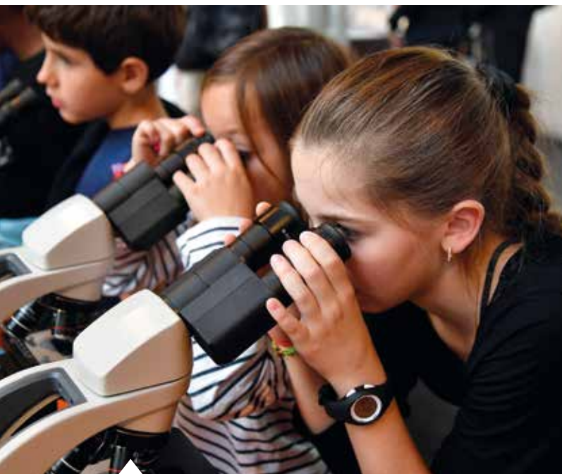
Des jeunes participant à la Fête de la Science en octobre 2023 à l'Université Paris-Évry-Saclay.

Riche de près de 300 villes sur les cinq continents, le réseau des Villes Apprenantes, coordonné par l'Unesco, fournit aux villes membres l'inspiration, le savoir-faire et les expériences utiles pour donner corps à la démarche. Il vise à stimuler, à l'échelle locale, le dialogue et les partenariats autour des politiques d'apprentissage, à identifier les stratégies efficaces et les bonnes pratiques, à partager des idées et à élaborer des outils concrets au service du bien commun. Au-delà des webinaires réguliers, la Ville a ainsi eu l'occasion de recevoir plusieurs délégations de villes européennes et coréennes notamment, et de prendre part à des événements apprenants en République de Moldavie, en Irlande, en Belgique, en Allemagne, en Corée du Sud ou en Chine par exemple.