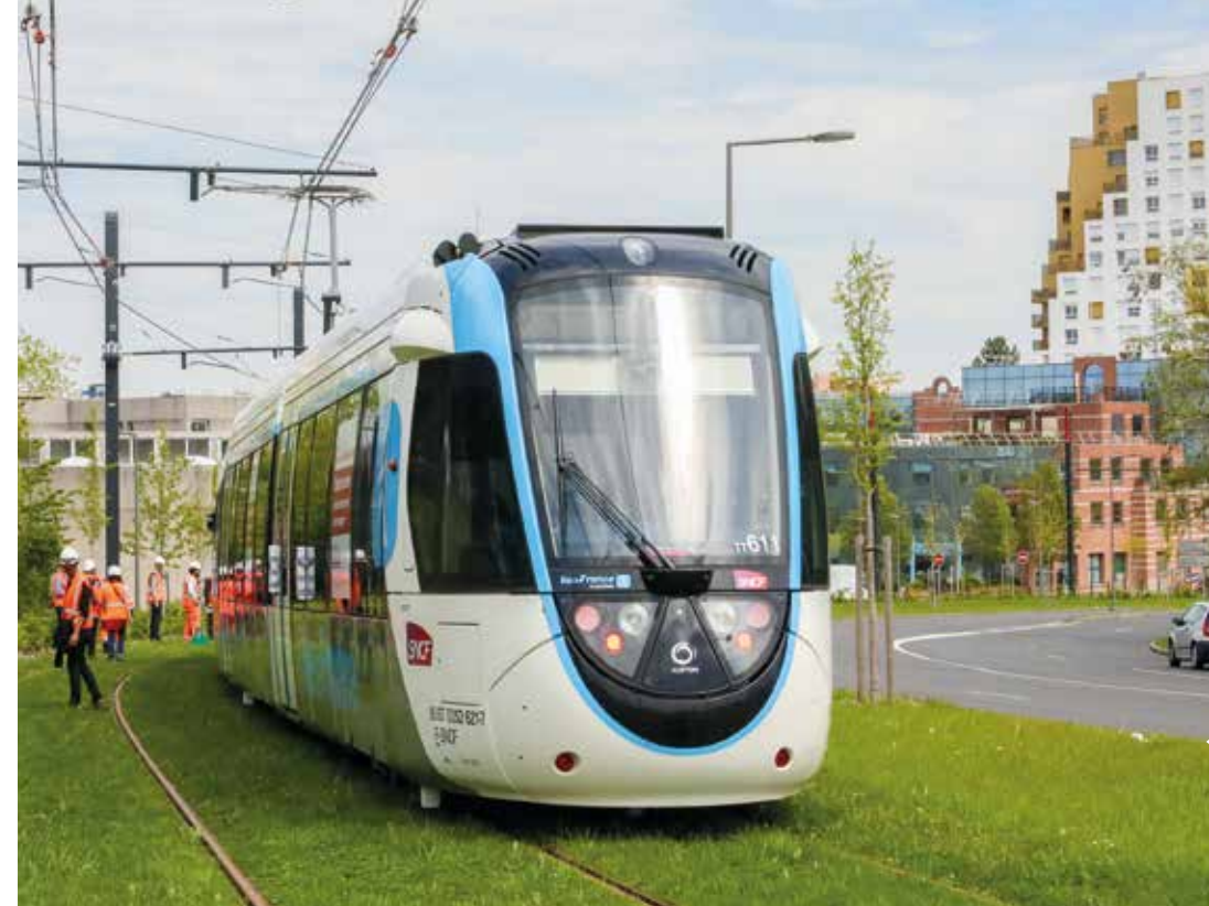
Prévue pour le 10 décembre 2023, la mise en service du Tram T12 conforte Évry-Courcouronnes dans son statut de centre névralgique de l'Essonne.

Sous l'impulsion des associations d'usagers et des collectivités locales, avec le soutien de Stéphane Beaudet, une démarche inédite de co-construction a été mise en place pour obtenir le retour des trains directs depuis Malesherbes ou Corbeil via la Vallée (gare d'Évry-Val de Seine). Les premiers exercices seront mis en œuvre à compter du SA 2025, c'est à dire en décembre 2024.