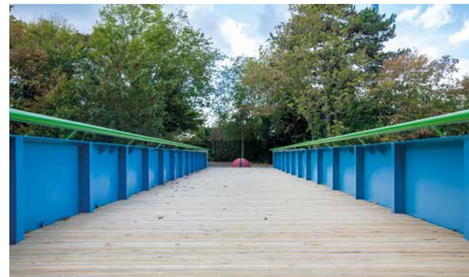
Livrée en septembre 2023, la passerelle des Loges a été entièrement rénovée pour un montant de 250 000 €.