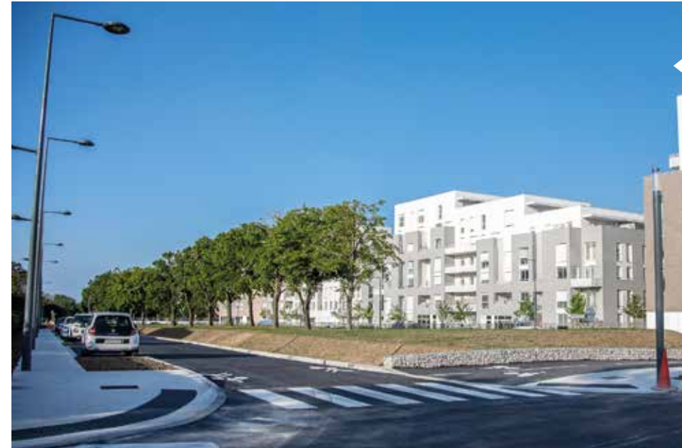
En pleine rénovation, le quartier du Parc aux lièvres - Bras de Fer a également entraîné la requalification du boulevard des Coquibus. (Photo : 22 novembre 2022).