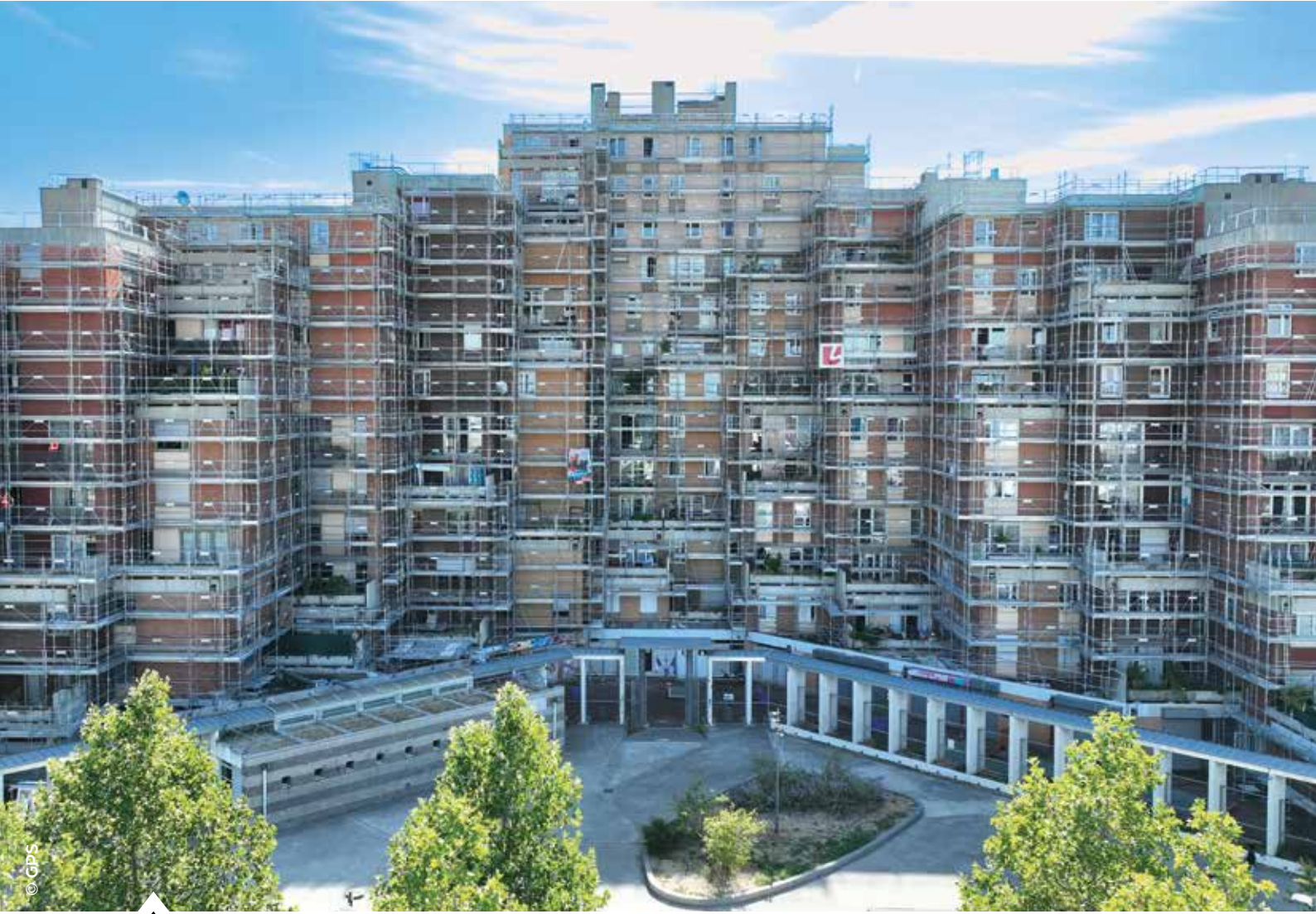
Le quartier historique des Pyramides est au cœur d'un vaste programme de transformation urbaine. Un chantier mené non loin de la place Jules Vallès, elle-même repensée.