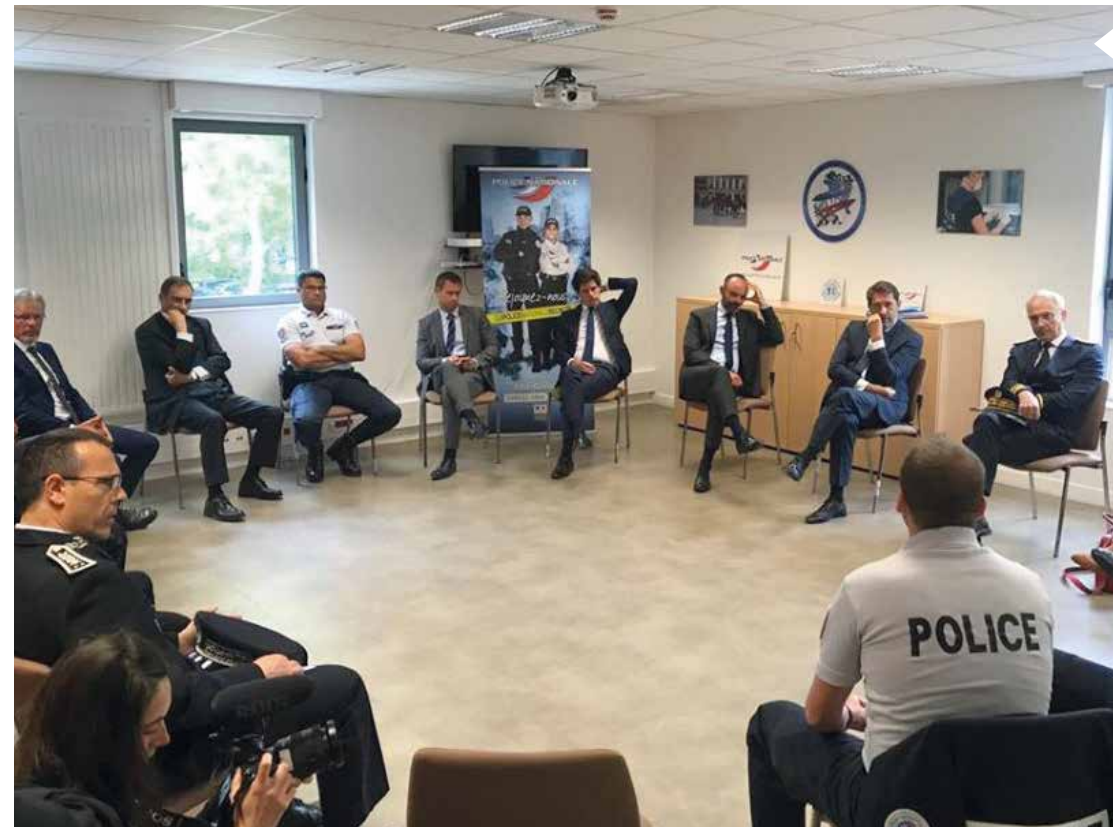
Le 8 juin 2020, le Premier ministre Édouard Philippe (troisième en partant de la droite) a rencontré les forces de l'ordre d'Évry-Courcouronnes pour échanger sur la sécurité avec les acteurs de terrain. Le chef du gouvernement était accompagné des ministres Christophe Castaner (Intérieur) et Julien Denormandie (Ville et Logement).

Capitale de l'Essonne, Évry-Courcouronnes a accueilli de nombreuses personnalités nationales et internationales depuis le début du mandat municipal, en 2020. Tour d'horizon.