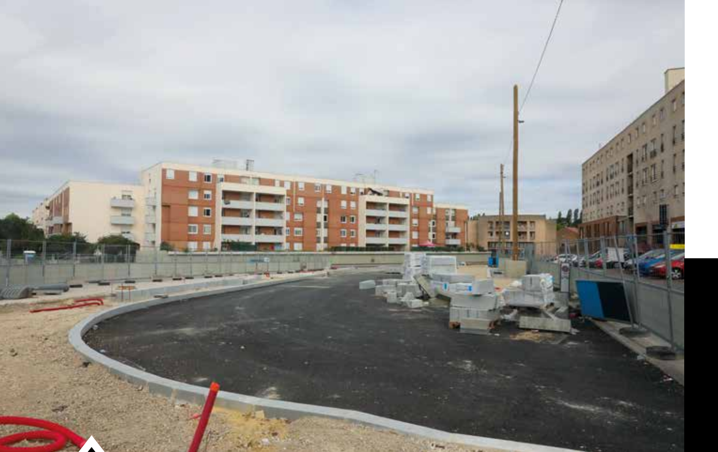
Le quartier du Canal connaît lui aussi une transformation d'envergure pour préparer l'arrivée du TZen 4, une nouvelle génération de bus 100% électrique, et de nouveaux logements sur le site de l'ancien hôpital Louise Michel.