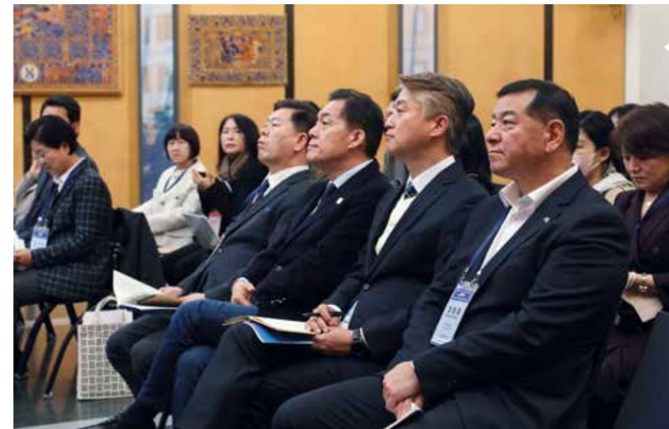
Visite à l'Hôtel de Ville d'une délégation de plusieurs élus sud-coréens, le 17 novembre 2022, dans le cadre du dispositif Ville apprenante de l'Unesco.