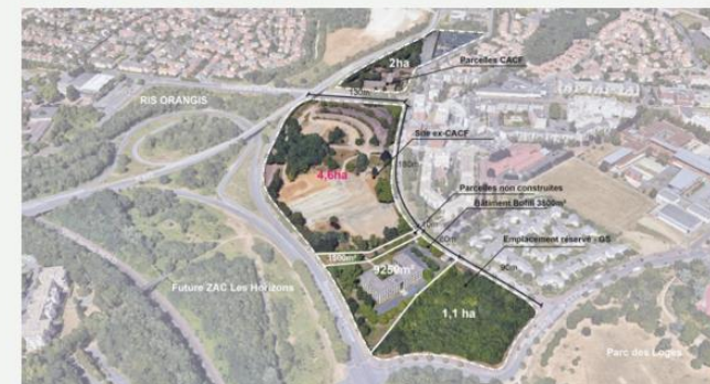
Extrait du flyer présenté lors de la balade paysagère