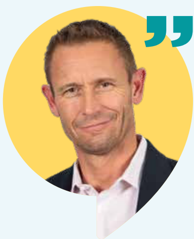
Stéphane Beudet Maire d'Évry-Courcouronnes