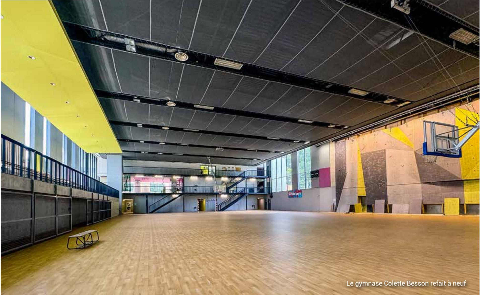
Le gymnase Colette Besson refait à neuf