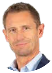
Stéphane BEAUDET Maire d'Évry-Courcouronnes