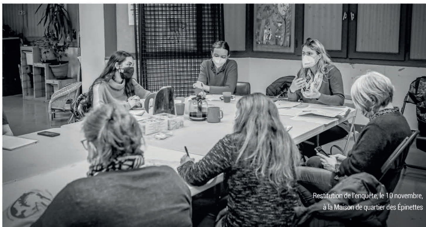
Restitution de l'enquête, le 10 novembre, à la Maison de quartier des Épinettes