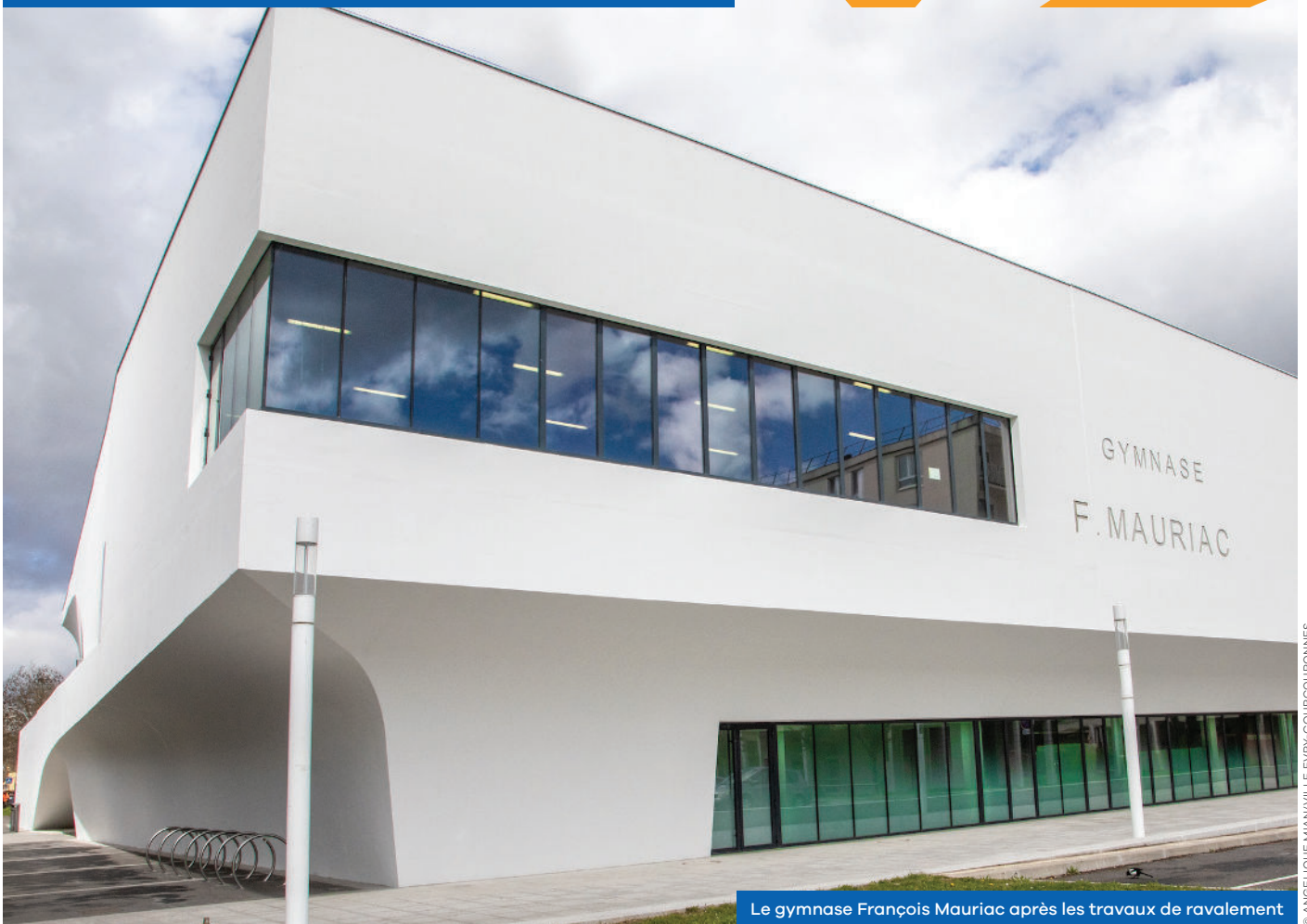
Le gymnase François Mauriac après les travaux de ravalement