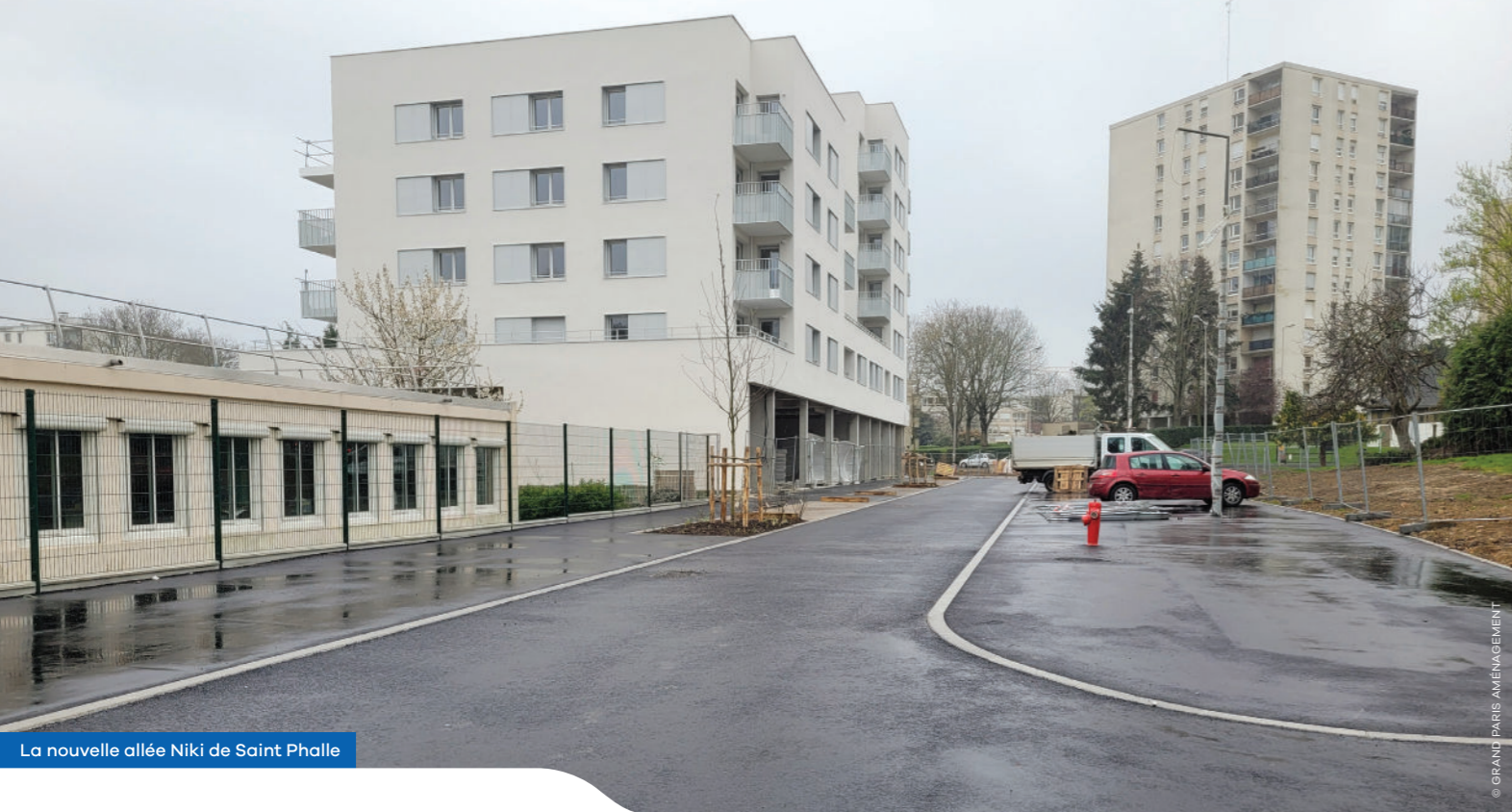
La nouvelle allée Niki de Saint Phalle

Dans le cadre de la rénovation du quartier Parc aux Lièvres-Bras de Fer, les travaux se poursuivent et de nouveaux chantiers seront lancés dès mai 2023. Retrouvez ci-après l'ensemble des informations pratiques.