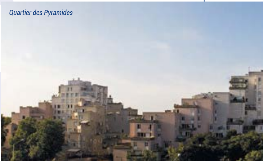
Quartier des Pyramides