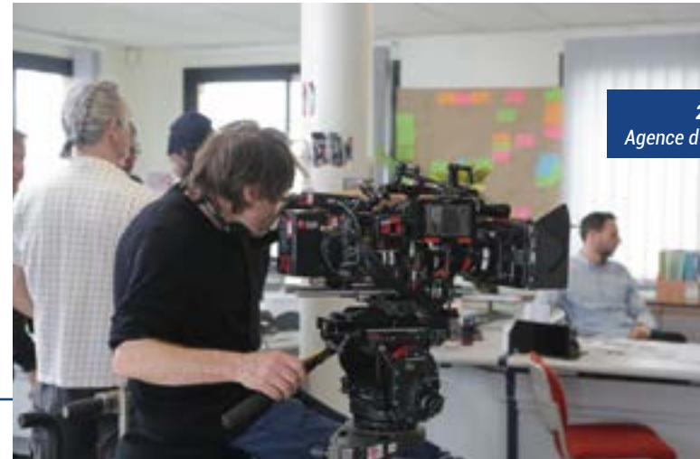
2020, Mytho Agence d'assurance COGESUR