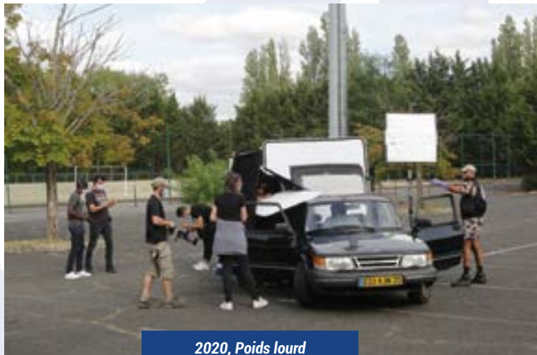
2020, Poids lourd Parking Évry Val-de-Seine