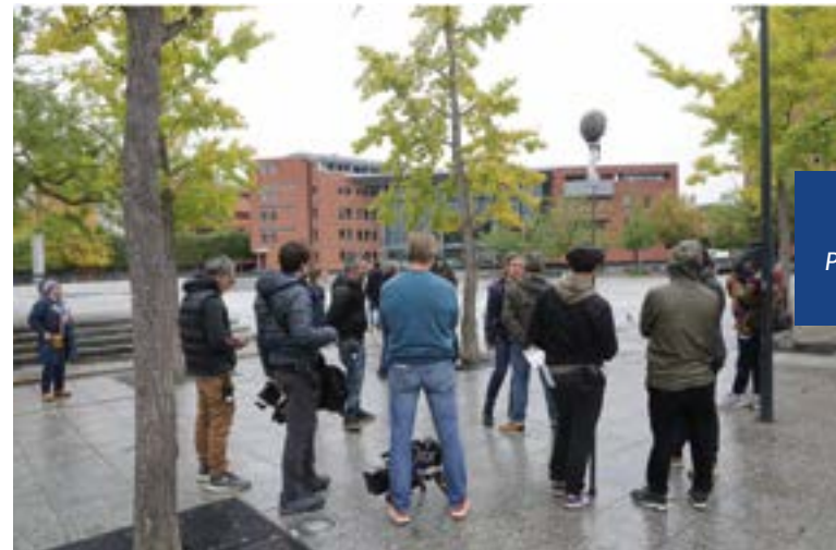
2020, La vie devant soi (titre provisoire) Place des Droits de l'Homme et du Citoyen