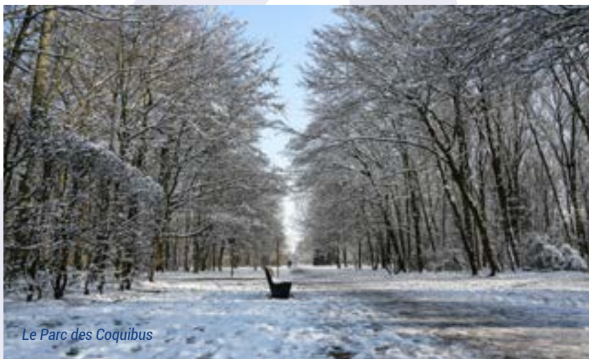
Le Parc des Coquibus