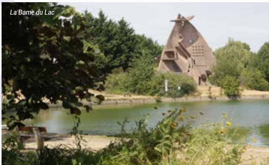
La Dame du Lac